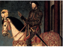
Francesco I, Re di Francia (François Clouet)

Tradizionalmente utilizzato nei Balcani e nelle regioni dell'Asia (Impero russo e India), lo yogurt fu introdotto più tardi in Europa dal Re Francesco I, dopo averlo utilizzato per una diarrea grave .