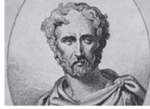
Plinio il Vecchio

I testi più antichi che menzionano lo «yogurt» sono attribuiti a Plinio il Vecchio il quale riportò che alcune tribù di nomadi sapevano come «addensare il latte in una sostanza dall'acidità gradevole».