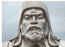
Genghis Khan, Imperatore Mongolo

Genghis Khan, il fondatore dell'Impero Mongolo, si pensa abbia nutrito il suo esercito con lo yogurt, un alimento alla base della dieta dei Mongoli, considerato fonte di forza e coraggio per i suoi guerrieri.